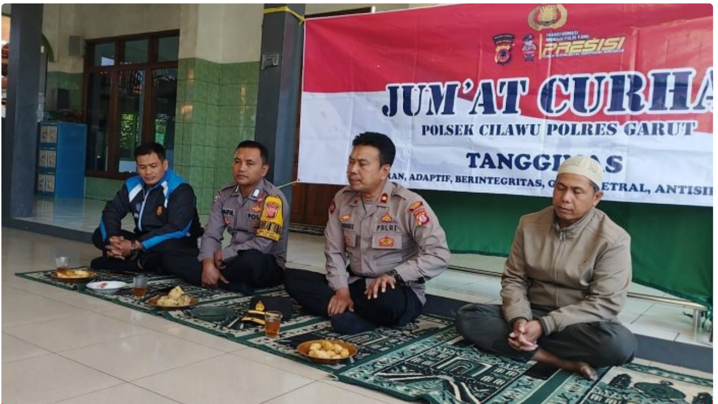
Kapolsek Cilawu mendengarkan curhatan warga